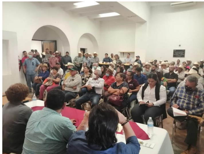
Foros de Cooperativismo / Regiones del Estado