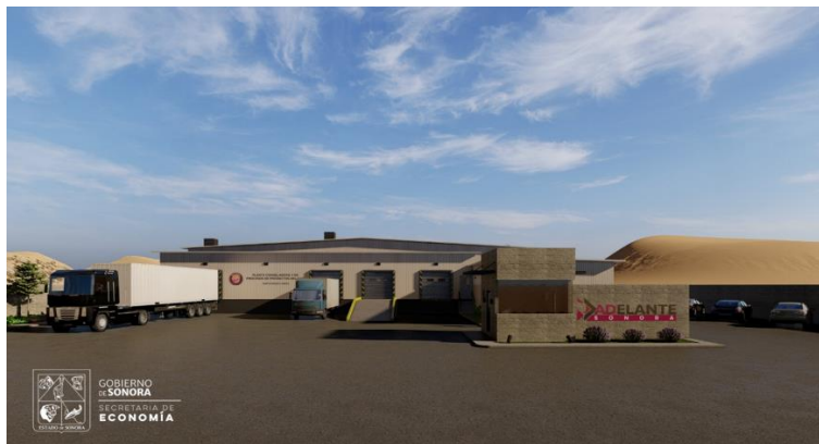
Planta congeladora y de procesos de productos del mar. Puerto Peñasco, Sonora S.C. Unión de Marineros y Pescadores de Altamar de Puerto Peñasco.